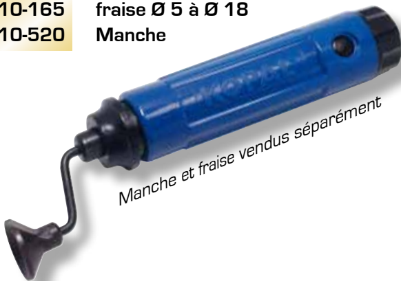
Manche et fraise vendus séparément