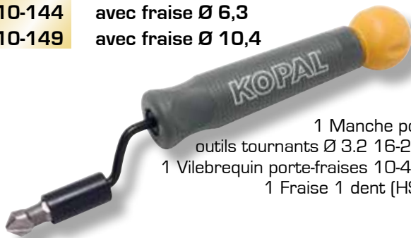
1 Manche pour outils tournants Ø 3.2 16-230 1 Vilebrequin porte-fraises 10-422 1 Fraise 1 dent (HSS)