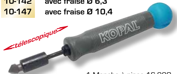
1 Manche à pince 16-220 1 Tige télescopique porte-fraises (1/4") 10-421 1 Fraise 1 dent (HSS)