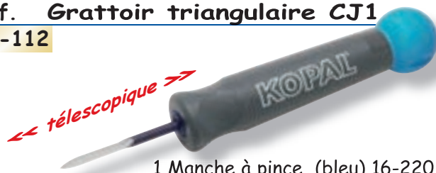
Réf. Grattoir triangulaire CJ1 10-112

1 Manche à pince (bleu) 16-220 1 Grattoir C1 ; 2.5 mm sur plat (HSS) 10-412