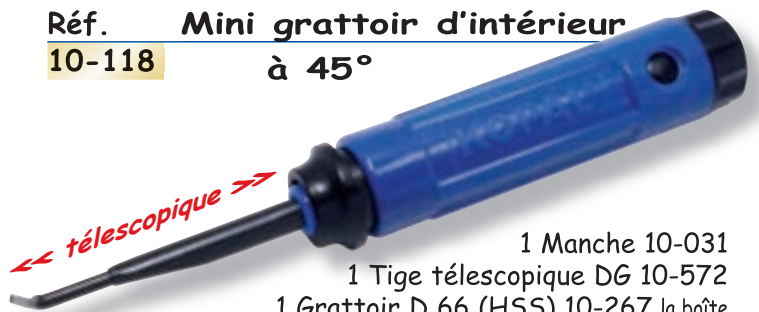
Réf. Mini grattoir d'intérieur à 45° 10-118

1 Manche 10-031 1 Tige télescopique DG 10-572 1 Grattoir D 66 (HSS) 10-267 la boîte