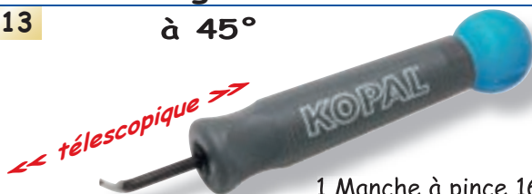
Réf. Mini grattoir d'intérieur CJ2 à 45° 10-113

1 Manche à pince 16-220 1 Grattoir C 2 (HSS) 10-413